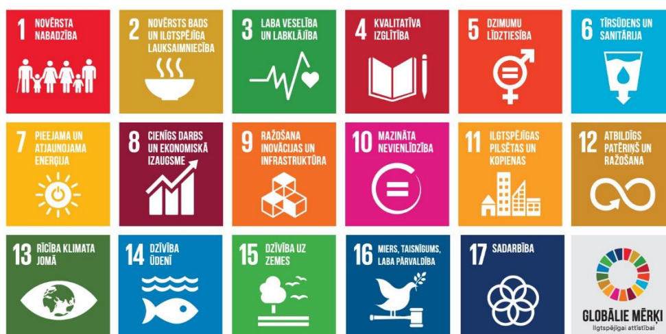
1.attēls. Apvienoto Nāciju organizācijas globālie Ilgtspējīgas attīstības mērķi

Slimnīca atbalsta un sniedz pienesumu Apvienoto Nāciju organizācijas Ilgtspējīgas attīstības mērķu 2 (skatīt 1.attēlu) tiešā vai netiešā sasniegšanā.