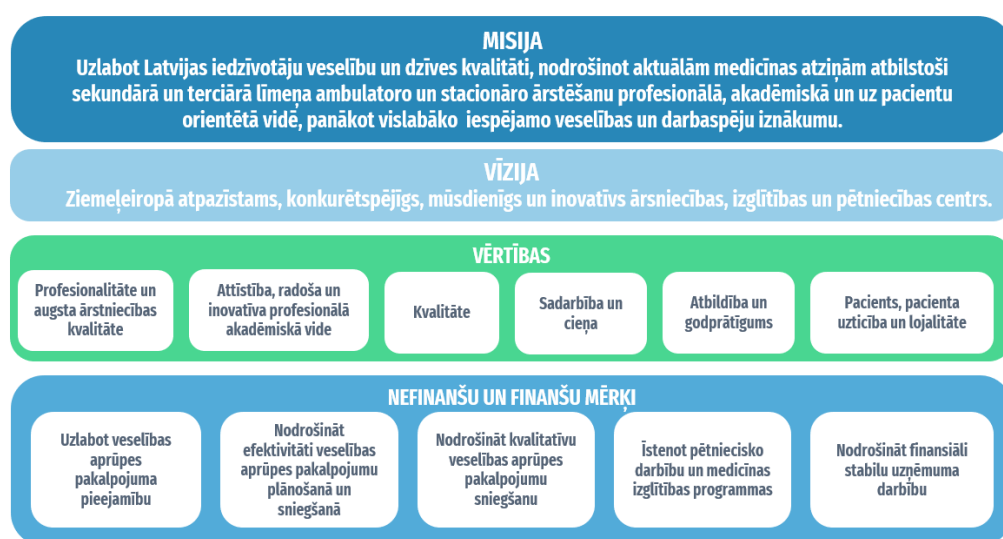
2.attēls. Slimnīcas misija, vīzija, vērtības, mērķi 2020. – 2022.g.

Slimnīcas darbība 2022.gadā norit atbilstoši “Valsts sabiedrības ar ierobežotu atbildību “Paula Stradiņa klīniskās universitātes slimnīca” Kapitālsabiedrības vidējā termiņa darbības stratēģija 2020.-2022.gadam” noteiktajam stratēģiskajam mērķim – saglabāt, uzlabot un atjaunot Latvijas iedzīvotāju veselību un dzīves kvalitāti, nodrošinot kvalitatīvus, efektīvus un pieejamus plaša spektra terciārā līmeņa, neatliekamās un plānveida veselības aprūpes pakalpojumus, vienlaikus nodrošinot klīnisko bāzi ārstniecības personu izglītībai un zināšanu pārnesei, kā arī zinātnes un pētniecības attīstību.